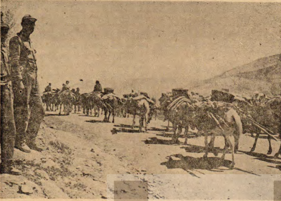
Aşiretler Yazlığa Göçüyor

Doğu Anadolu da çeşitli bölgelerde hareket eden pek çok göçebe aşiret mevcuttur. Fakat en yoğun oldukları yer, Urfa - Bingöl, Tunceli, Mardin, Siirt, Diyarbakır, Van gölü çevresi Hakkâri yöreleridir. Bunlar halihazır durumda kürtçe konuştukları için «Kürt Aşiretleri» demek daha doğrudur. Bu ifade aynı zamanda onlar kendilerine benzeyen diğer sosyal gruplardan ayırmak bakımından da yerindedir. Gerçekten Doğu Anadolu'nun çeşitli yörelerinde hareket eden göçebe kürt aşiretlerini sosyal organizasyon ve değer sistemleri toplumsal farklılaşma, dışarıya açılma ve dış faktörlerle bütünleşme yönünden Toros dağlarında dolaşan Türkmenlerden, Ege Bölgesinde hareket eden Yörüklerden ve halen ticaret göçebeliği yapan ve göçebeliği etnik bir karakter olarak devam ettiren çingenelerden ayırmak gerekir.