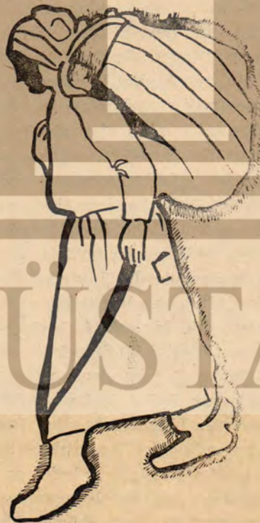
Desen : Sibel OSKAY

Reis bu fonksiyonları ile birlikte emretme gücünü de kaybetmiş, yalnız yaylak