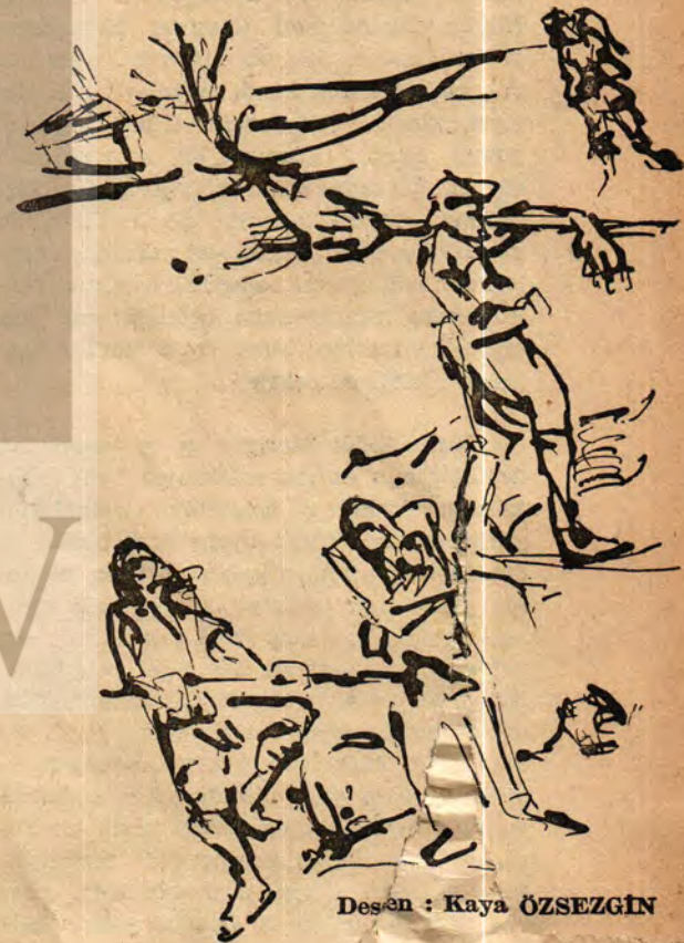
Desen : Kaya ÖZSEZGİN